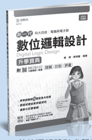
AD121 數位邏輯設計升學寶典