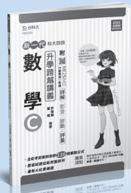
PD331 數學 C 升學跨越講義