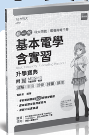
AD101 基本電學與實習升學寶典