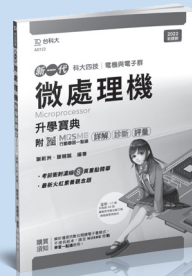
AD123 微處理機升學寶典