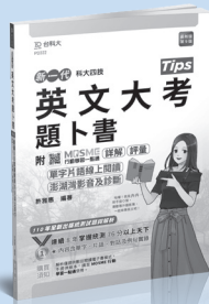
PD322 英文大考題卜書 (Tips)