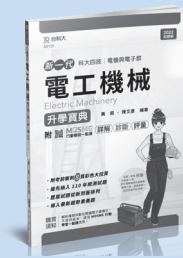
AD133 電工機械升學寶典