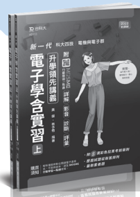
AD113 電子學與實習 (上) 升學領先講義 AD114 電子學與實習 (下) 升學領先講義