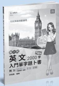
PD321 英文入門單字題卜書 (Tips)