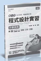
AD124 程式設計實習升學實典