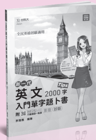
PD321 英文入門單字題卜書 (Tips)