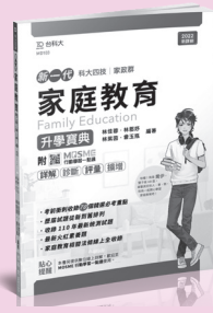
MD0103 家庭教育升學寶典