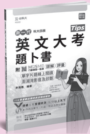
PD322 英文大考題卜書 (Tips)