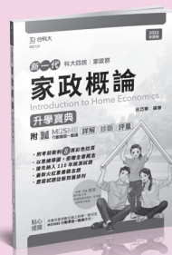
MD101 家政概論升學寶典