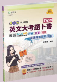
PD322 英文大考題卜書 (Tips)