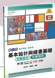
GD111 基本設計與繪畫基礎完美結合升學寶典