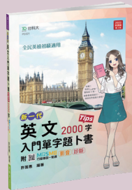
PD321 英文入門單字題卜書 (Tips)