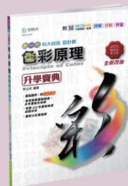
GD101 色彩原理升學寶典