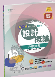
GD105 設計概論升學寶典