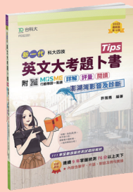
PD322 英文大考題卜書 (Tips)