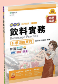
HD113 飲料實務升學金鑰寶典