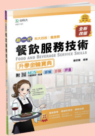
HD111 餐飲服務技術升學金鑰寶典