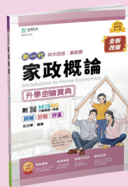
MD101 家政概論升學金鑰寶典