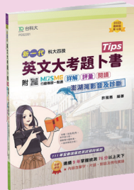
PD322 英文大考題卜書 (Tips)