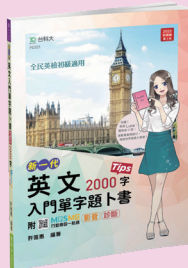
PD321 英文入門單字題卜書 (Tips)