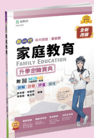
MD103 家庭教育升學金鑰寶典